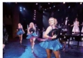
船内アクティビティ

※船内での高速 Wi-Fi、寄港地観光、(自動的に計上される) チップ代などは別途費用がかかります。